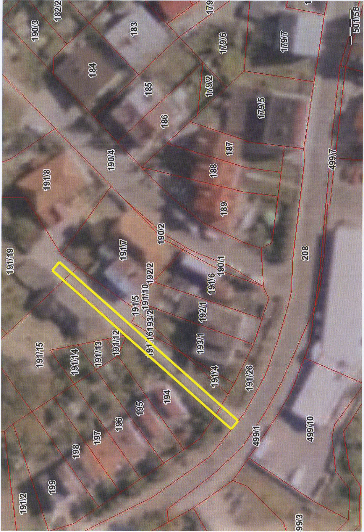
Naprawa drogi wjazdowej. Ustawienie lustra drogowego 3-kierunkowego oraz oświetlenie skrzyżowania przy ulicy Limanowskiego – załącznik graficzny